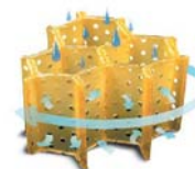
Système complet d'aération

Circulation d'air et évacuation de l'humidité